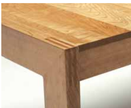
Modell 100: Klassische X-Pand Linie