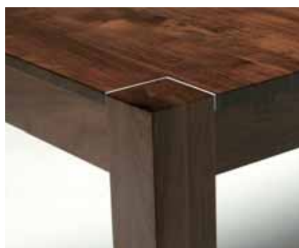
Modell 200: Moderne X-Pand Linie

Die X-Pand Möbellinie für den Innenbereich ist in unterschiedlichen Modellen und mit flexiblen Tischlängen am Markt. Entsprechend den persönlichen Lebensbedürfnissen, dem individuellen Wohnambiente und den persönlichen Anforderungen an modernes Einrichten. Das X-Pand System umfasst massive Esstische und Sitzbänke in unterschiedlichen Holzarten und Längen.